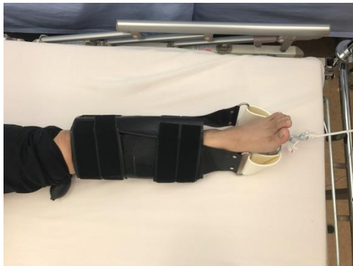
試作 1 号